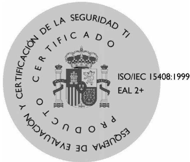
Figura 2. Distintivo de producto certificado con indicación del alcance

g) La altura del distintivo no será inferior a 15 mm, excepto cuando esto no sea posible a causa del tipo de producto.